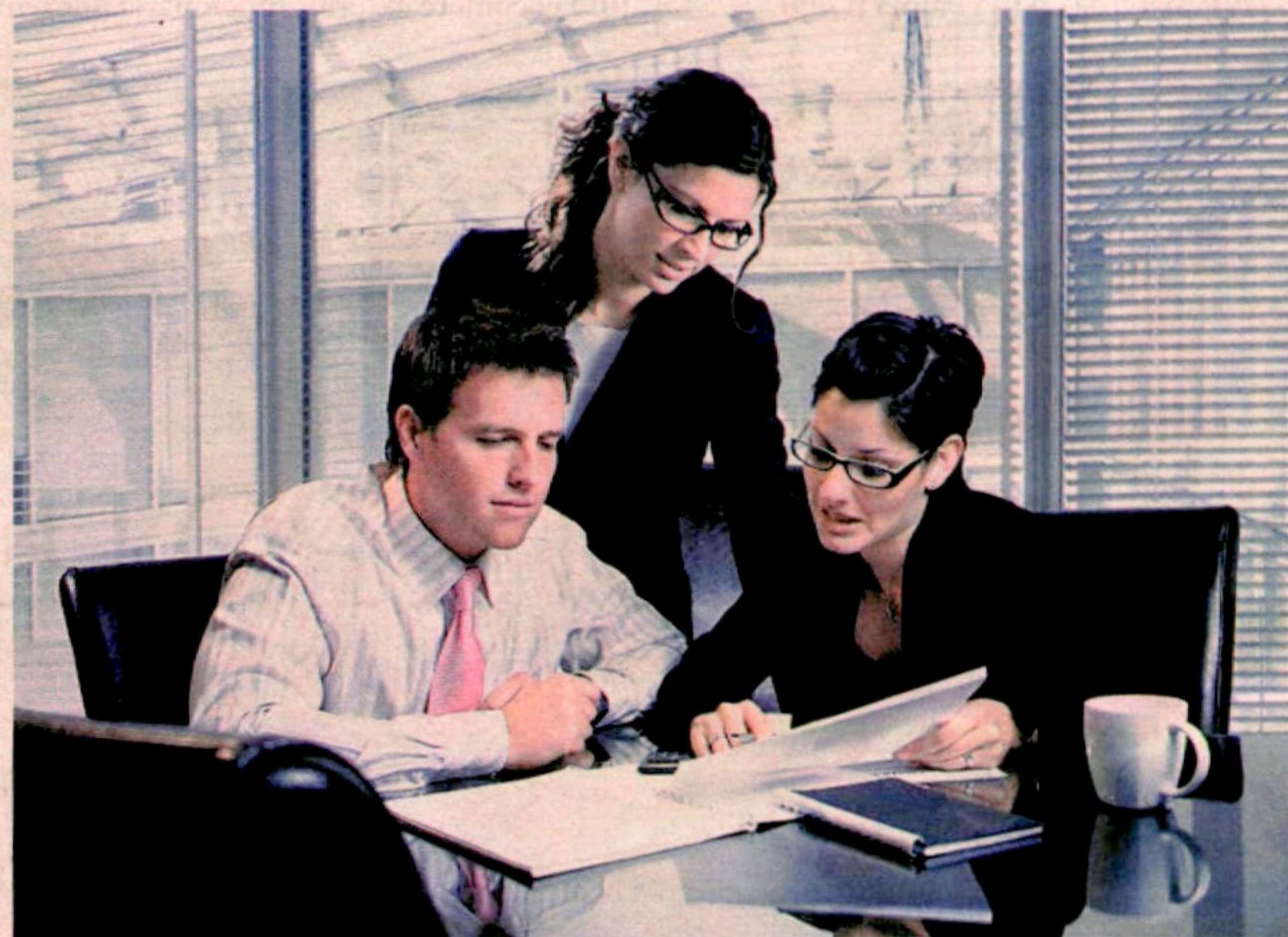
Les secretàries han assumit un rol més actiu dins les organitzacions empresarials.

L'estudi en qüestió revela que fins a un 80% de les secretàries afirma que el dia que ella no és a l'oficina "al meu cap li cau el món a sobre" i que en aquests casos